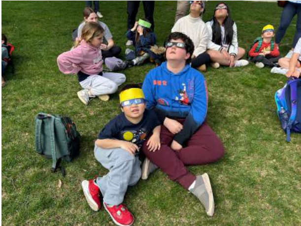
Sixth Graders enjoy April 8th's solar eclipse with Pre-K buddies.