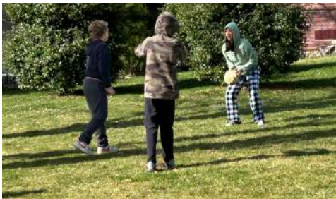
Recess – the best part of the day.

¡Nos gustaría desearles a todos un excelente descanso! ¡Esperamos con ansias una emocionante primavera de 2024 aquí en LBS!