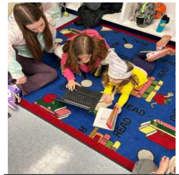
6th Graders read to Kindergarteners on Read Across America Day.

En matemáticas, continuamos terminando el volumen y el área de superficie de los prismas. Después de las vacaciones de primavera trabajaremos en presentaciones de datos y estadísticas, antes de hacer una revisión del NJSLA, lo cual estoy seguro que los estudiantes de sexto grado esperan con ansias (¡estamos aprendiendo sobre la ironía y el sarcasmo en sexto grado!). Mientras tanto, en ciencia, hemos completado nuestras exploraciones de fuerzas y movimientos y hemos trabajado con la electricidad. Esta semana hicimos una excursión al planetario RVCC, lo que será un presagio para el próximo mes cuando trabajaremos en algunas actividades solares relacionadas con el universo y la escala de tiempo geológico.